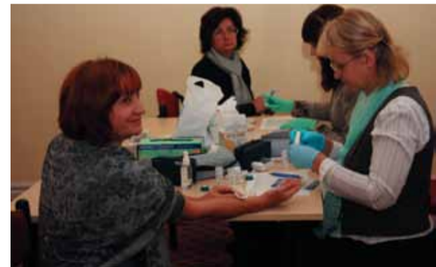
KNT südametervispäev Kunda klubis.

Lisaks südametervise päevale toimuvad sel aastal veel töötervishoiu arsti poolt läbi viidavad tervisekontrollid. Sellel aastal läbivad selle üle 170 töötaja. Hea meel on tõdeda, et see programm hõlmab ka töötervishoiu arsti poolset töökohtade külastamist, mis annab arstile parema arusaamise meie töötingimustest ning ohuteguritest.