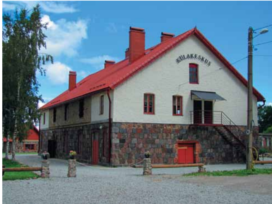
Kunda Nordic Tsemendi toetusel valmis Ubja külakeskus

Nii on juba aastaid toimunud Kunda linna jooks, kus peaauidadeks meie toodang. Pidevalt on toetatud võrkpallivõistkondade tegevust, spordikeskuse tegutsemist, erinevate kohalike võistluste korraldamist. Spordi valdkonnas on viimasel ajal lisandunud ka korvpalli ja saalihoki tegevuse ja arengu toetamine. Kultuuri valdkonnas on toetust saanud paljud Kunda klubi juures tegutsevad ringid, erinevad linna traditsioonilised